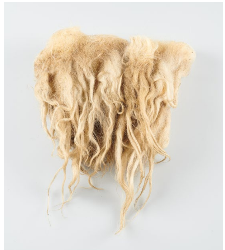
Haare des Walachenschafs

In Anbetracht der umfassenden Zerstörung der planetaren Ökosysteme hat sich in den USA, Kanada und Australien eine Bewegung etabliert, die sich eine emotionale Reaktion auf die bereits zu verzeichnenden sowie die sich abzeichnenden Verluste von Leben und Vielfalt erlaubt. In Deutschland ist der Begriff Umwelttrauer weitestgehend unbekannt und der Diskurs wird weder öffentlich noch politisch geführt. Damit entfällt auch die Möglichkeit das Gefühl der Trauer als Ressource zu nutzen, es mit Sinn zu füllen, es zu teilen, es als Antrieb zum Handeln zu verstehen – es ins Positive zu transformieren. Diesem Versuch der Transformation soll hier über eine künstlerische Auseinandersetzung – zwischen vom Aussterben bedrohten Tierarten und vom Aussterben bedrohten Kunsthandwerk – nachgegangen werden.