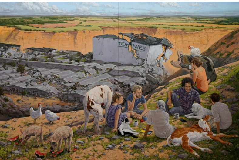
Hartmut Kiewert, Hügel, 2020, Öl auf Leinwand, 250 x 380 cm

Auch wenn wir uns als Kinder des Kapitalismus keine Blaupausen für eine Utopie befreiter Menschen und anderer Tiere auspinseln können, ist es dennoch wichtig über die Kritik am Bestehenden hinaus positive Narrative und Gegenbilder zu schaffen. Seit etwa 10 Jahren versuche ich in meinen Bildwelten den hegemonialen Blick auf andere Tiere, insbesondere so genannte „Nutztiere“ zu verschieben und ein herrschaftsfreies Mensch-Tier-Verhältnis vorschein zu lassen. Schweine, Kühe und Hühner sind den Mastanlagen und Schlachthöfen entkommen und erobern menschliche Wohnräume, Parks, Shoppingmalls und Straßen. Die Tierindustrie ist ruiniert und Menschen und andere Tiere begegnen sich auf Augenhöhe.