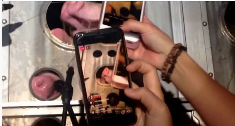
Still: Kamera-Ethnografische Untersuchungen zu Medien- und Körperpraktiken bei Pig Vigils, Found-Footage

Im Rahmen meiner Diplomarbeit frage ich nach der Im/mobilität von nichtmenschlichen Tieren im Kontext der Tierindustrie. Was zeichnet die Mobilität dieser Tiere aus, was bedeutet sie für den Prozess der Kommodifizierung, und welche Rolle spielt der Tierrechtsaktivismus? Mit einer Bandbreite an Medien und künstlerisch-forschenden Methoden, versuche ich mich in einer Annäherung an einen Begriff der Im/mobilität, der dem komplexen, prekären und transgressiven Handeln und Erleben der Tiere gerecht wird.