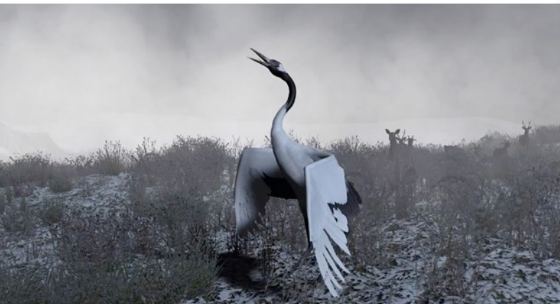
Still: Internal other (2019, 3D-Animation, ca. 10 min)

Internal other beschäftigt sich mit den gefährdeten Tierarten im „Grenzübergreifenden Schutzgebiet“ der demilitarisierte Zone zwischen Nord- und Südkorea. In über 66 Jahren und über 155 Meilen hinweg hat sich dieses Gebiet zu einem „Zufalls-Wildtierparadies“ für bedrohte Arten entwickelt, darunter der Rotkopfkranich, der in der koreanischen Tradition als Glück verheißendes Tier eine besondere Rolle einnimmt. Er ist Symbol für ein langes Leben, für Treue und Moral und für die Berggötter spirituelles Vehikel und Medium zwischen Himmel und Erde. Der Rotkopfkranich nimmt in dieser Arbeit die Rolle des schamanischen Erzählers ein. Auf seinem magischen Flug führt er uns durch virtuelle und metaphorische Landschaften hindurch zu realen und imaginären Orten in dieser Zone und zu unseren eigenen inneren schneebedeckten Berglandschaften. Im Rahmen ihres neuen Projekts „An Uncontacted tribe – the true point of view“ führt Hanna Noh das Thema als digitale Performance fort.