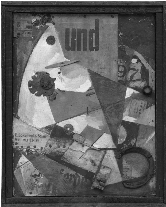
Abb 1: Kurt Schwitters, Das Undbild , 1919. Collage; 35,8 × 28 cm.

Das Undbild von Kurt Schwitters entstand am Ende des Weltkrieges, und zwar im Zusammenhang der so genannten MERZbilder. Seit 1918 benutzte der Künstler den Ausdruck MERZ, den er aus dem Zerschneiden des Schriftzugs Commerz hervorgehen ließ. Schwitters hatte die Neigung, Textstücke für seine Collagen vorne abzuschneiden, nicht etwa hinten. Dies entsprach der dadaistischen Praktik, Sätze rückwärts zu lesen, um ihren Sinn zu unterlaufen. Für die MERZkunst sollte neben zerschnittenen Typographien jedes weitere Material zugelassen sein, auch Müll sowie Maschinenteile usw. Schwitters sprach von MERZkunst und MERZbildern: »Sie werden verstehen, daß ich ein Bild mit dem Wort MERZ das MERZbild nannte, wie ich ein Bild mit und das und-Bild [...] nannte.«